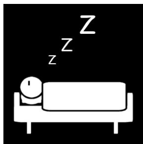
Säng och sömn