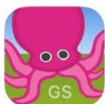
Green Screen By Do Ink